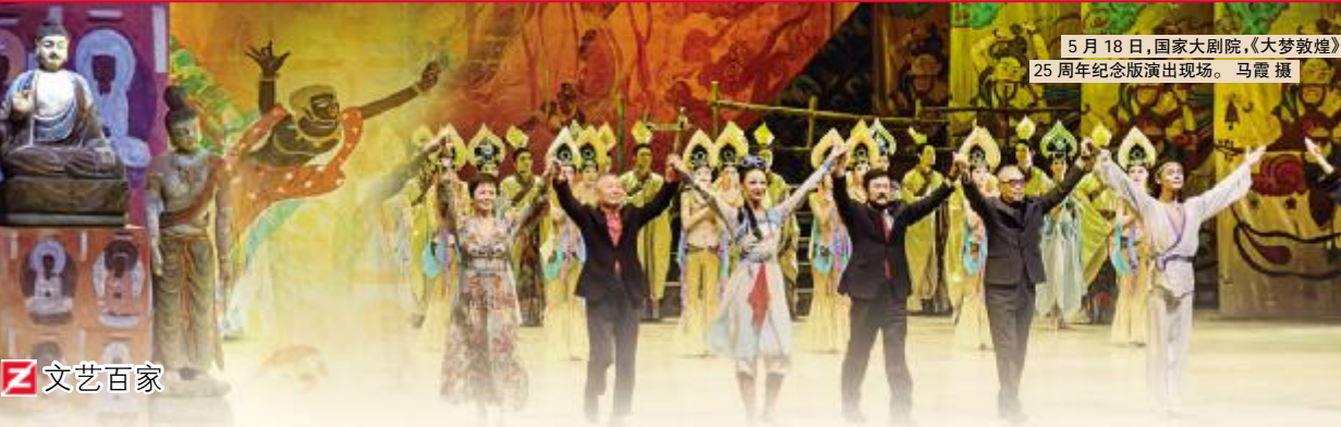
5月18日，国家大剧院，《大梦敦煌》25周年纪念版演出。